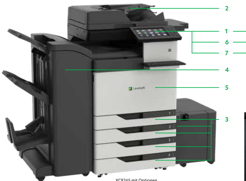
XC9265 mit Optionen

Drucken Sie Microsoft Office-Dateien, PDFs und andere Dokument- und Bildarten von Flash-Laufwerken, oder wählen Sie Dokumente auf Netzwerk-Servern oder Online-Laufwerken aus und drucken Sie sie.