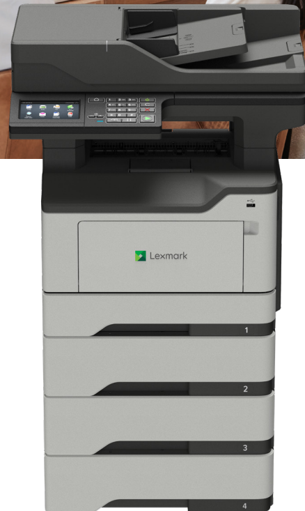
XM1246 mit optionalen Fächern

Zuverlässigkeit. Sicherheit. Produktivität.