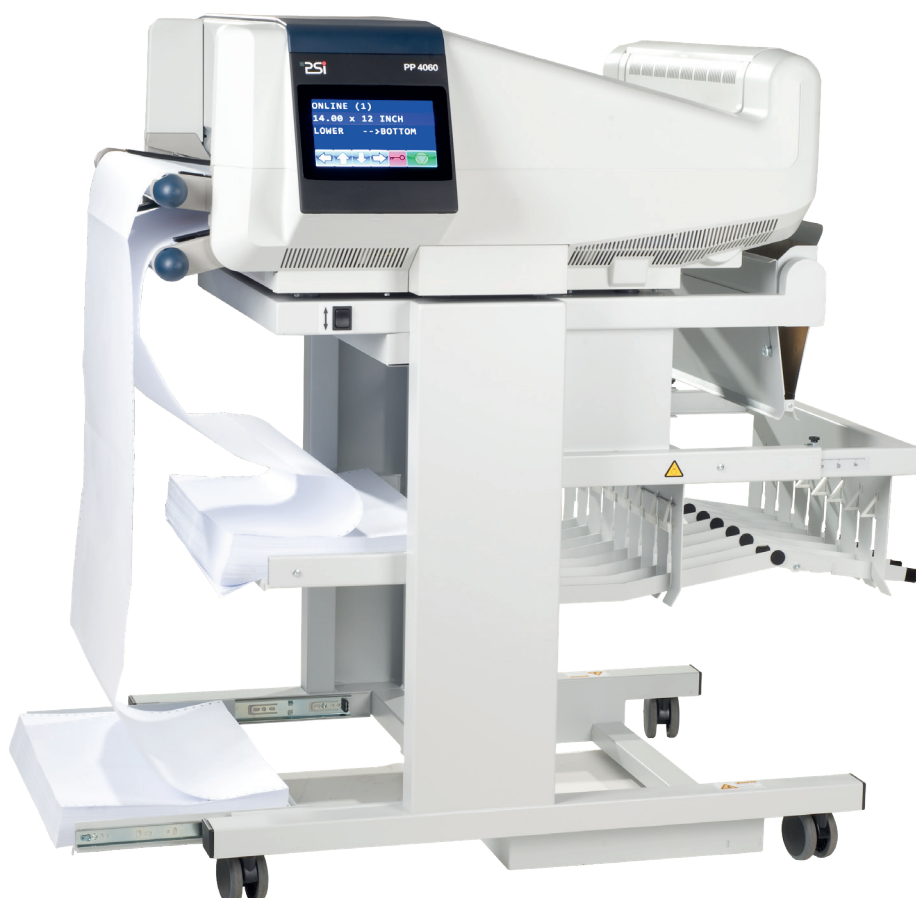
PP 4060 mit optionalem Papierstapler iPS 4050